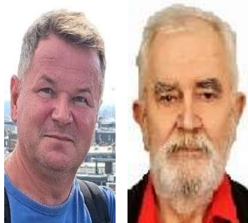
Sławek BTZ PTTK Józek IPA Kraków