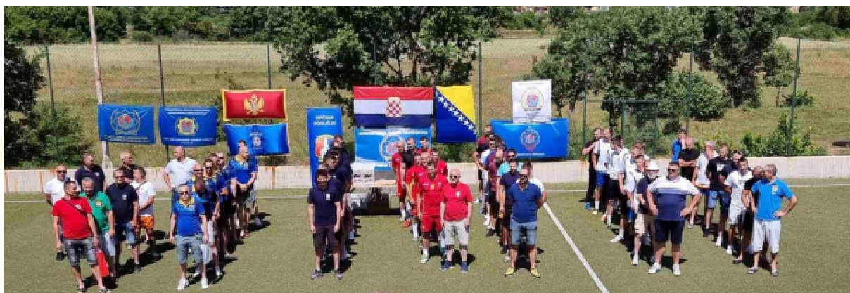
Ceremonia otwarcia z udziałem wszystkich drużyn

Drużyna IPA Vukovar z Chorwacji, która tym razem nie brała udziału w turnieju, wygrała tymczasowe trofeum na własność w 2019 roku, po wygraniu turnieju trzy razy z rzędu.