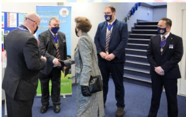
JKW z członkami Zarządu Krajowego Sekcji IPA UK