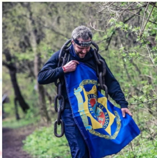
Spacer z łańcuchami

Pierwszy członek zespołu IPA ukończył bieg po 1:15h godzinach, a ostatni po 1:54h, nasi zawodnicy IPA uczcili swoje osiągnięcie przy obfitym posiłku i bawarskim piwie.