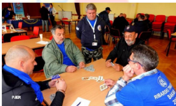
Członkowie IPA podczas gier Triathlonu

Ponadto spożywali wino i specjalne wino musujące zwane "Bakarska vodica". - Woda Bakarska - wytwarzana z winogron uprawianych przez rolników na skalistym zboczu zatoki Bakarskiej.