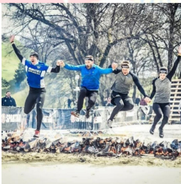
Razem przez ogień

W sierpniu 2022 r. Sekcja IPA Niemcy weźmie udział drużynowo w Xletix Challenge, trudnym wyścigu z błotem i przeszkodami w pobliżu Stadtdendorf w Niemczech: