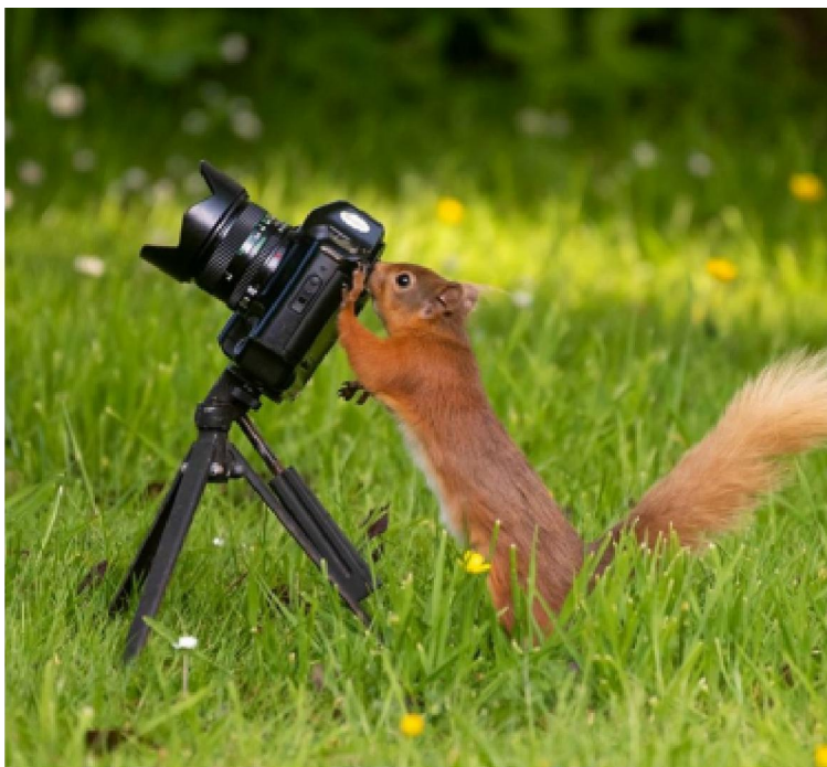
Zwycięska fotografia Międzynarodowego Konkursu Fotograficznego 2022