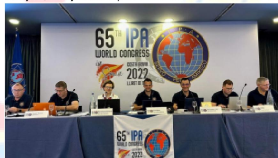
IEB gotowy do pracy

sekcjom, audytorom i przedstawicielom Gimbora za ich