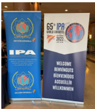
Mile widziani w Hiszpanii